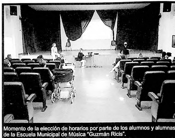
Momento de la elección de horarios por parte de los alumnos y alumnas de la Escuela Municipal de Música "Guzmán Ricis".

La duración del curso será hasta finales de mayo y la media de alumnos/as por profesor es de 25. Se debe tener en