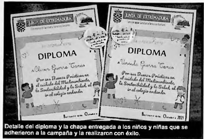
Detalle del diploma y la chapa entregada a los niños y niñas que se adherieron a la campaña y la realizaron con éxito.

Se entregó a los niños y niñas del CEIP Hernando de Soto que quisieron participar, previa inscripción, una cartilla en la que se había dejado los huecos por día en el que pegar una pegatina que sería entregada por miembros de protección civil. Estos voluntarios se ubicaron en puntos estratégicos y de obligado paso hacia las instalaciones educativas (cruce calle Virgen de Guadalupe con Francisco Rubio, lugar conocido como "El Muelle", salida Parque de la Constitución por la zona de aparcamientos y puerta Estadio Municipal "Antonio Cuerda").