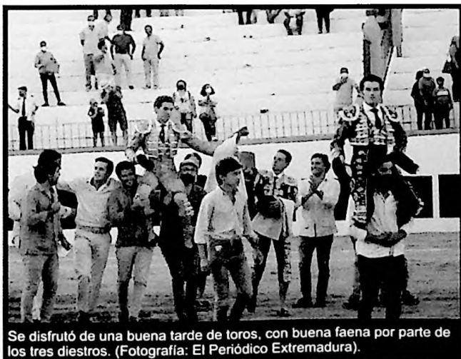
Se disfrutó de una buena tarde de toros, con buena faena por parte de los tres diestros.

(Fuente: TENTAERO 11/09/2021 en www.hoy.es ) ■