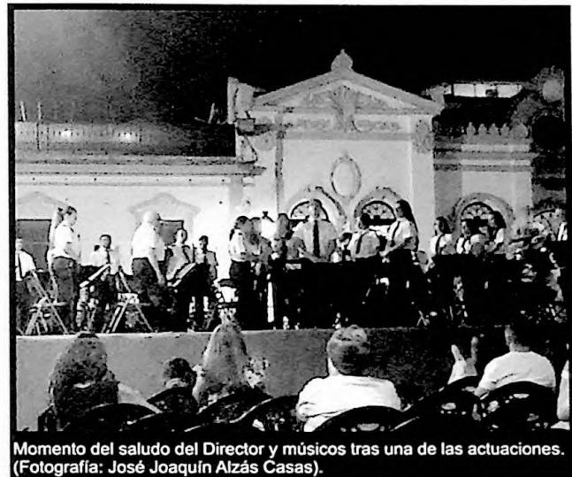
Momento del saludo del Director y músicos tras una de las actuaciones.