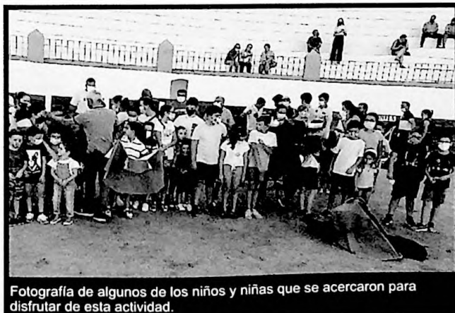
Fotografía de algunos de los niños y niñas que se acercaron para disfrutar de esta actividad.

Tuvo lugar en la Plaza de Toros, iniciándose a las 19:00 horas, y consistió en la exposición de trajes y utensilios de toreo así como una demostración de toreo de salón en la que participaron los