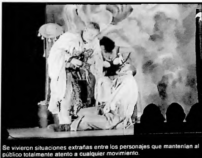
Se vivieron situaciones extrañas entre los personajes que mantenían al público totalmente atento a cualquier movimiento.

Tras él, llega el sacamuelas Monipodio, con sus coplas satíricas, pócimas salvadoras, instrumentos de cirugía y múltiples secretos para aliviar