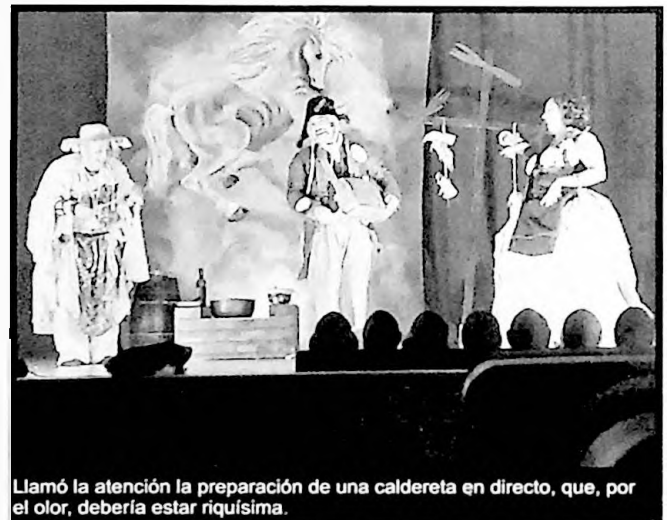
Llamó la atención la preparación de una caldereta en directo, que, por el olor, debería estar riquísima.