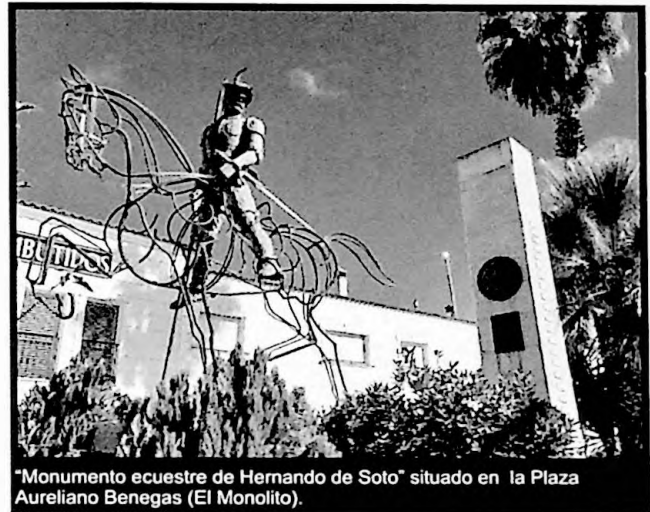
"Monumento ecuestre de Hernando de Soto" situado en la Plaza Aureliano Benegas (El Monolito).

Desde el punto de vista técnico el monumento se realiza en mármol, con la función de ser una fuente ornamental colocada en el centro de la entonces Plaza de la Constitución, hoy Plaza de España, como La CRÓNICA de BADAJOZ del día 13 de agosto de ese año relataba: "...en la plaza pública de dicha villa, se ha colocado una fuente circular de 3 metros y 16 centímetros, adornada de una gradería, también circular; en el centro de dicha fuente, y a la altura de 72 centímetros, se ha levantado un elegante pedestal de orden dórico, de más de un metro de altura; y sobre él se ha colocado la estatua del conquistador, de una sola pieza y de tamaño natural...". En el frente de ese pedestal o peana aparece inscrita la dedicatoria de Barcarrota a su héroe y en el lado opuesto, figuran los nombres de las batallas más señaladas en las que participó, y el nombre de los barcarroteños que lo acompañaron. Mientras, en los lados restantes, se sitúan los relieves de dos cabezas de leones que