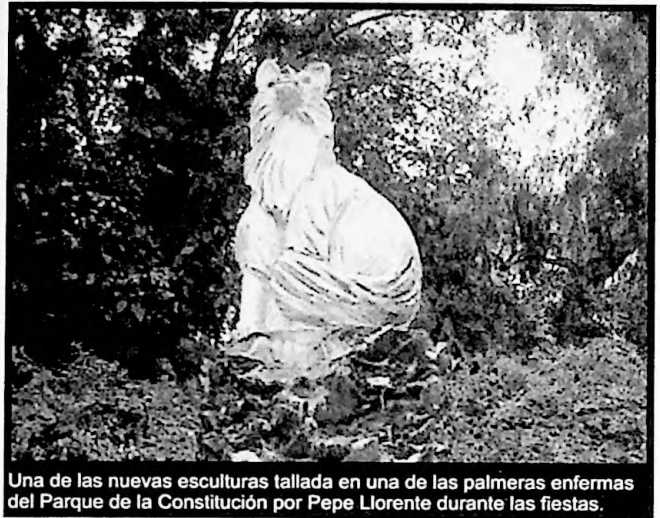
Una de las nuevas esculturas tallada en una de las palmeras enfermas del Parque de la Constitución por Pepe Llorente durante las fiestas.

Un día más Pepe Llorente estuvo en Barcarrota para mostrar su destreza con el motosierra esculpiendo figuras en los troncos