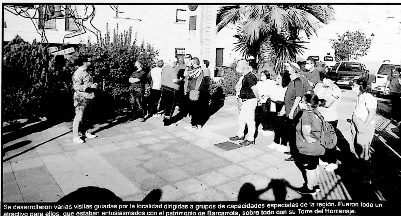
Se desarrollaron varias visitas guiadas por la localidad dirigidas a grupos de capacidades especiales de la región. Fueron todo un atractivo para ellos, que estaban entusiasmados con el patrimonio de Barcarrota, sobre todo con su Torre del Homenaje.

Ver sus sonrisas, su agradecimiento y la pasión que mostraban cuando aprendían algo de cada rincón de nuestra localidad, no tiene precio.