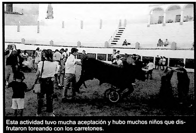
Esta actividad tuvo mucha aceptación y hubo muchos niños que disfrutaron toreando con los carretones.