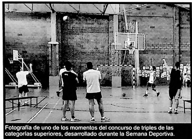
Fotografía de uno de los momentos del concurso de triples de las categorías superiores, desarrollado durante la Semana Deportiva.

Se desarrollaron competiciones en disciplinas como pádel, tenis de mesa, natación, atletismo, vóley playa, concursos de triple, entre otras, dándole vida a todo el complejo deportivo con el que se cuenta en nuestra localidad. ■