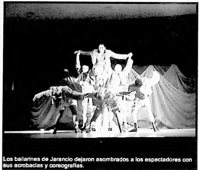
Los bailarines de Jarancio dejaron asombrados a los espectadores con sus acrobacias y coreografías.

Este espectáculo estuvo financiado por el Programa de Dinamización Cultural de la Diputación de Badajoz. ■