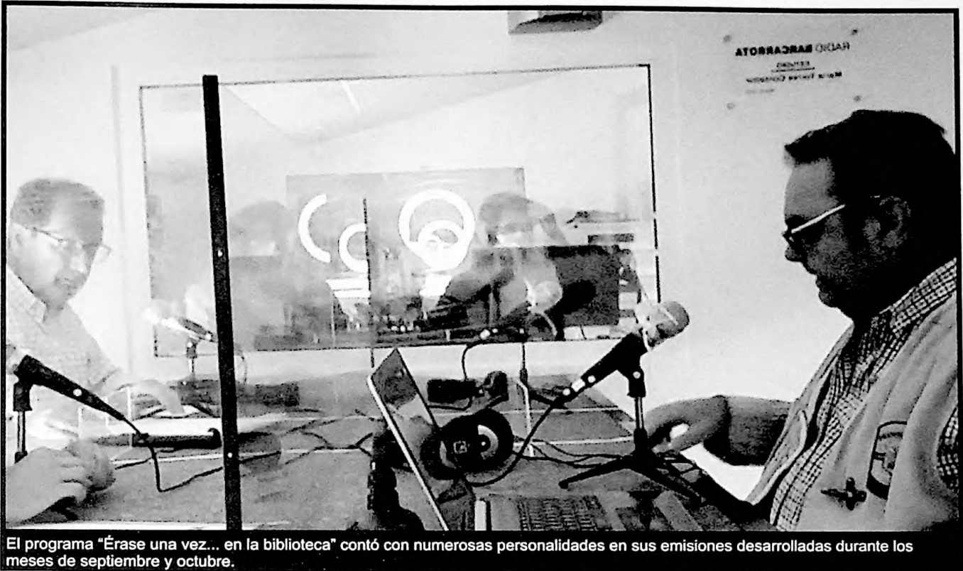
El programa "Érase una vez... en la biblioteca" contó con numerosas personalidades en sus emisiones desarrolladas durante los meses de septiembre y octubre.