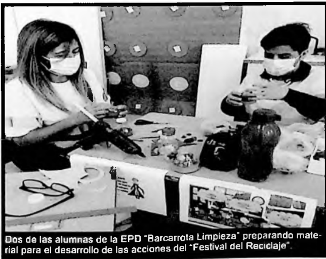
Dos de las alumnas de la EPD "Barcarrota Limpieza" preparando material para el desarrollo de las acciones del "Festival del Reciclaje".

El segundo fue de Igualdad de Género, y las actividades: "Juegos de tarjetas donde había un rol", "Calendario de