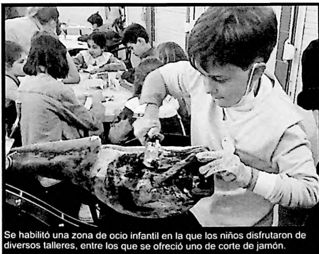
Se habilitó una zona de ocio infantil en la que los niños disfrutaron de diversos talleres, entre los que se ofreció uno de corte de jamón.

Esta edición se ubicó un espacio dedicado a los niños, en el que se ofertaron diferentes talleres creativos y gastronómicos (creación de chapas, corte de jamón, elaboración de embutidos...). Para