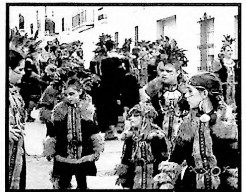
1er PREMIO COMPARSAS ENTRE CUATRANCIAS Y BIENBESTÍOS, ¡ACHO QUE LÍO!