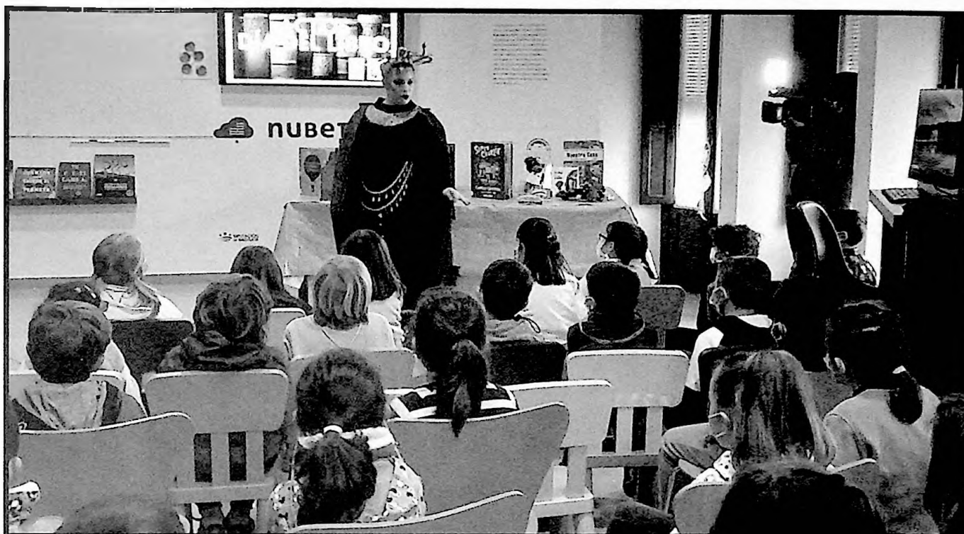
Desde el programa "Muévete" de Canal Extremadura TV se interesaron por conocer el funcionamiento y el día a día de la Biblioteca Pública Municipal "Francisco de Peñaranda", para recibir a los miembros del mismo, se preparó un cuenta-cuentos teatralizado.