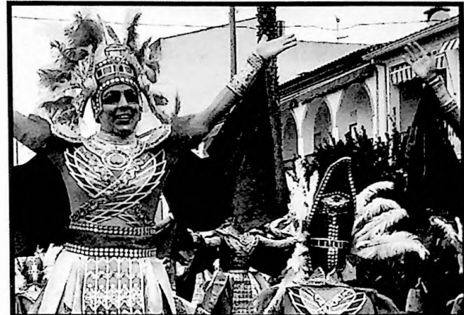
Los ritmos de "Los Lingotes" le valieron para hacerse con el premio "Mejor Música". Esta agrupación ganó el primer premio en el desfile pacense.

Más de mil personas llenaron las calles de Barcarrota de color, a pesar del mal tiempo, gracias a la participación en este encuentro de las agrupaciones "Tarakanova" de Olivenza, "Stanmajaras" de Alconchel, "Achikitú" de Don Benito, "Caretos Salvavidas" de Badajoz, "Sanyati" de Salvaleón, "Caribe" de Badajoz, "Themba" de Don Benito, "Wailuku" de Badajoz, "Los desertores" de Badajoz, "Valkeraí" de Talavera la Real, "Donde vamos la liamos" de Olivenza y "Los Lingotes" de Talavera la Real.