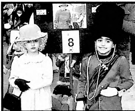
1er PREMIO PAREJAS LA REINA ISABEL II Y SU GUARDIA