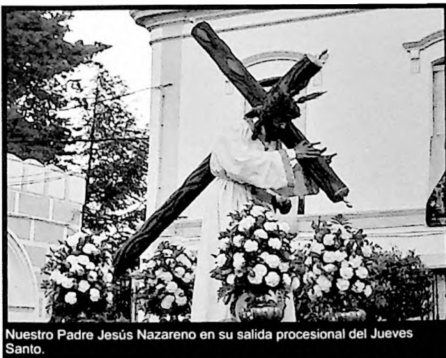
Nuestro Padre Jesús Nazareno en su salida procesional del Jueves Santo.

El Martes Santo, 12 de abril, estaba programado el Vía Crucis con el paso del Cristo de la Buena Muerte, que se desarrolla por el casco histórico de Barcarrota. La amenaza de lluvia llevó a que fuera suspendido.