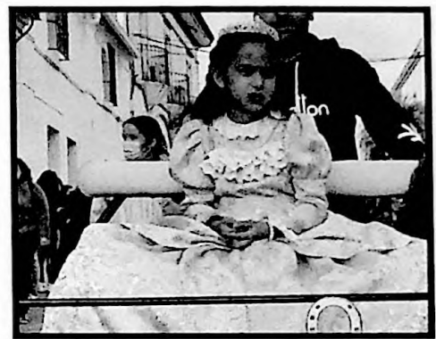
3º PREMIO INDIVIDUAL LA PRINCESA DORADA