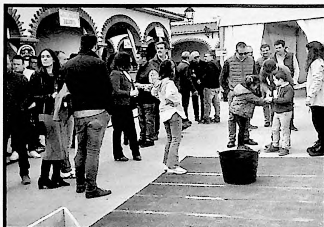
El I Concurso "Bellotas al cubo", novedad esta edición, contó con una gran expectación.

dos asociaciones de mujeres de la región, con lo cual, el tercer premio quedó desierto. Las premiadas fueron, con el Primer Premio (300 €), la Asociación de Mujeres "Finibus Terrea" de Almendral, que presentó una Tarta de Rey, y, el Segundo Premio (200 €), la Asociación de Mujeres "Francisca Sosa" de Barcarrota, que esta ocasión preparó un flan de piña con frutas.