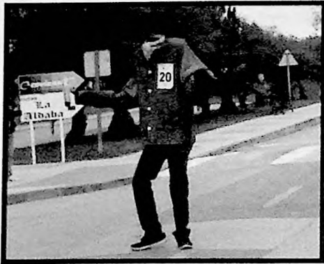
1er PREMIO INDIVIDUAL HOMBRE INVISIBLE