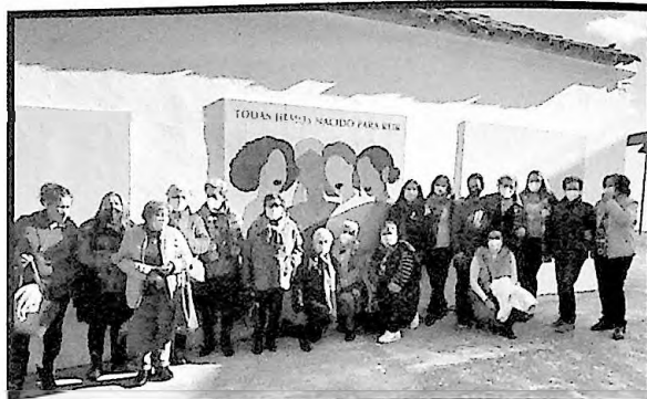
Fotografía para el recuerdo junto al mural dedicado a la mujer, ubicado en el Centro Cultural "Luis García Iglesias".

Los actos por este día continuaron el viernes, 11 de marzo, con un cuenta-cuentos dedicado a la igualdad dirigido a niños de 1º a 4º de primaria, que tuvo lugar en las instalaciones de la Biblioteca Pública Municipal "Francisco de Peñaranda". ■