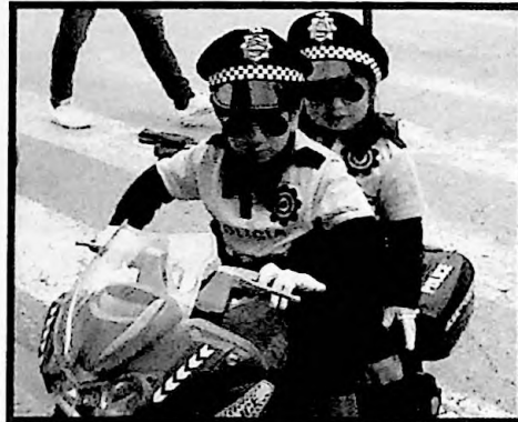
3º PREMIO PAREJAS NUESTROS POLIS