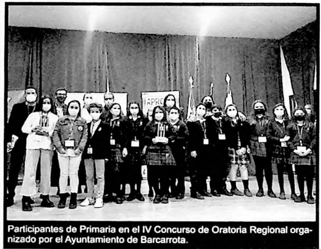
Participantes de Primaria en el IV Concurso de Oratoria Regional organizado por el Ayuntamiento de Barcarrota.