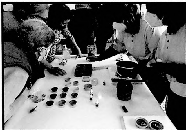
Con total atención siguieron las participantes las indicaciones dadas por las alumnas de la Escuela Profesional Dual "Barcarrota Limpieza".

Con moldes de silicona específicos para este tipo de acción, utilizando elementos naturales como ralladura de