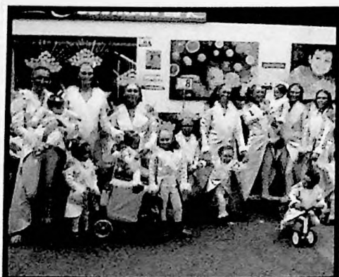
2º PREMIO COMPARSAS LAS REINAS DE LAS NIEVES