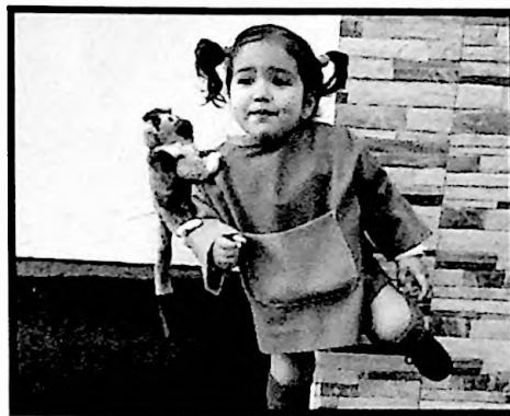
2º PREMIO INDIVIDUAL PEKINA CALZASLARGAS