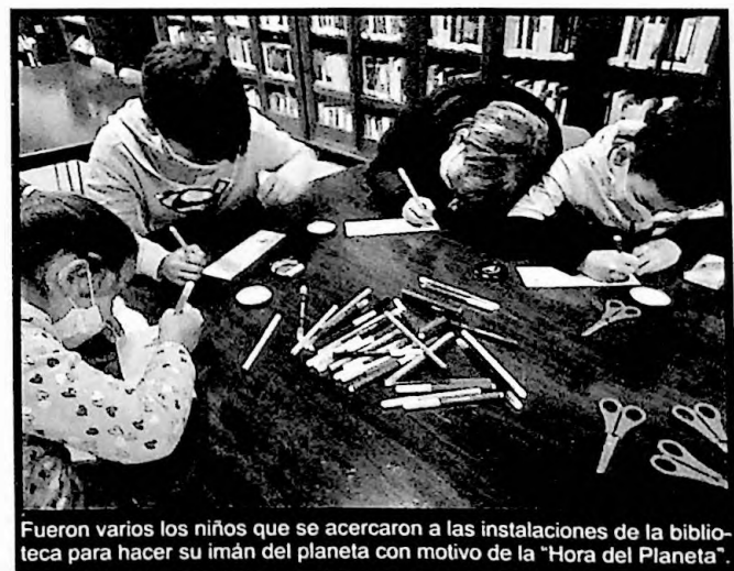
Fueron varios los niños que se acercaron a las instalaciones de la biblioteca para hacer su imán del planeta con motivo de la "Hora del Planeta".

Esta edición, además, se ha podido llevar a cabo un taller presencial dirigido a niños en el que, haciendo uso de la tapa de un tarro, crearon un bonito imán dedicado al planeta con el mensaje "Cuida el planeta". Esta acción tuvo lugar en las instalaciones de la Biblioteca Pública Municipal "Francisco de Peñaranda".