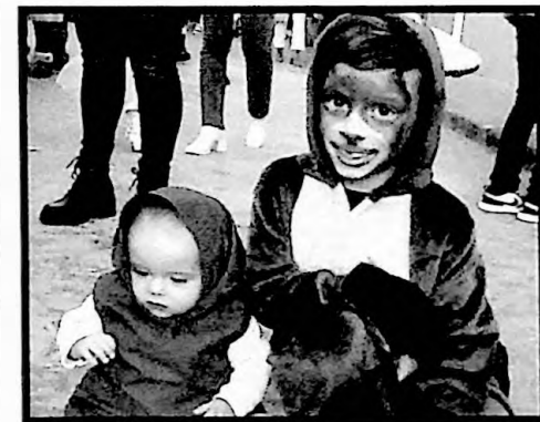
3º PREMIO PAREJAS MASHA Y EL OSO