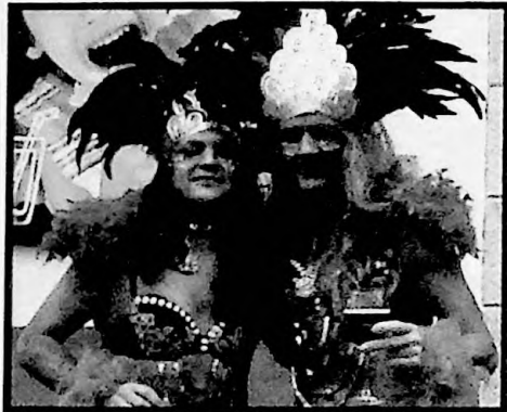
2º PREMIO PAREJAS LAS GIN TONIC BRASILEÑAS