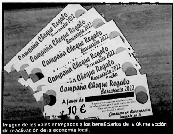
Imagen de los vales entregados a los beneficiarios de la última acción de reactivación de la economía local.

Se determinó un periodo para retirar, por parte de los agraciados, sus vales, en la casa de la cultura. Así mismo, se anunció que podían canjearse hasta el 4 de marzo, pudiéndose gastar, de manera íntegra, en cualquier establecimiento de la localidad a elegir por los beneficiarios, estando prohibido adquirir alcohol y/o tabaco.