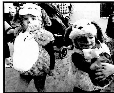
2º PREMIO PAREJAS LOS BOBY'S DOG