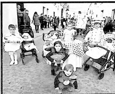
1er PREMIO MURGAS COMIRAPID.COM