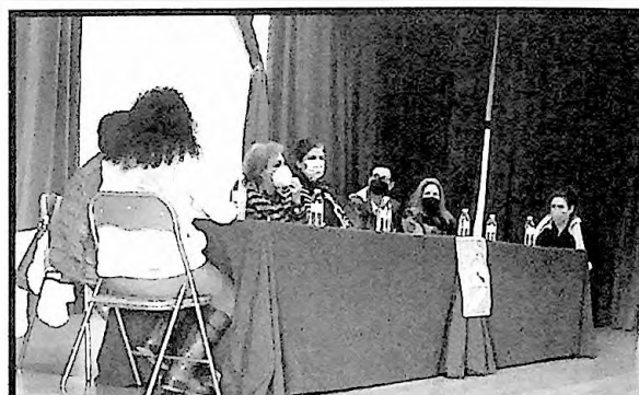
Momento de la Mesa Redonda en la que se conversó sobre cómo la situación de pandemia ha afectado a las mujeres.