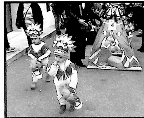
2º PREMIO MURGAS LOS APACHES