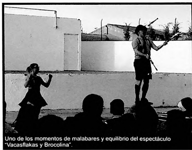
Uno de los momentos de malabares y equilibrio del espectáculo "Vacasflakas y Brocolina".

A través de ejercicios de equilibrios, malabares, con hula hoops..., y un montón de risas y carcajadas, estos dos payasos transportaron al público a un mundo de locura, diversión y ternura,