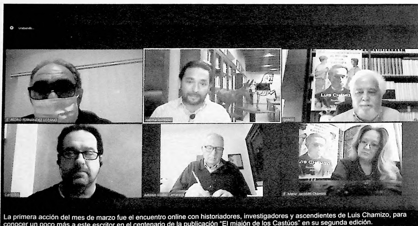
La primera acción del mes de marzo fue el encuentro online con historiadores, investigadores y ascendientes de Luis Chamizo, para conocer un poco más a este escritor en el centenario de la publicación "El miajón de los Castúos" en su segunda edición.

La otra conferencia se realizó en Fuente del Maestre, en la afamada Aula