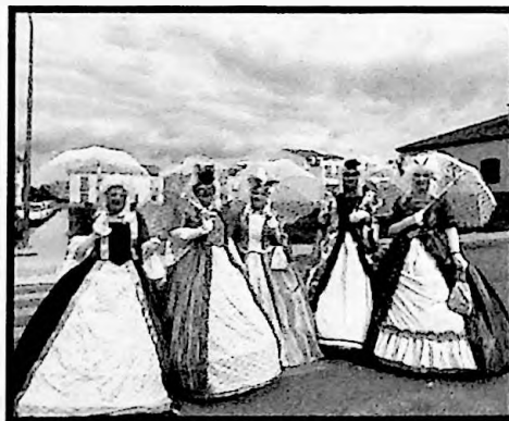
3º PREMIO MURGAS LAS MARQUESAS