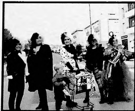
2º PREMIO MURGAS DE VIL AMIGUES DE LOS HIJOS DE PUTING