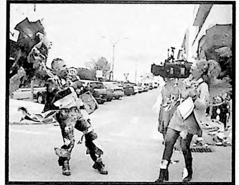
1er PREMIO PAREJAS EN ANTENA CON LA BORRASCA FILOMENA