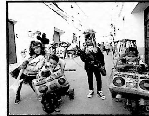
3º PREMIO MURGAS EL ROCK LLEGÓ A BARCARROTA