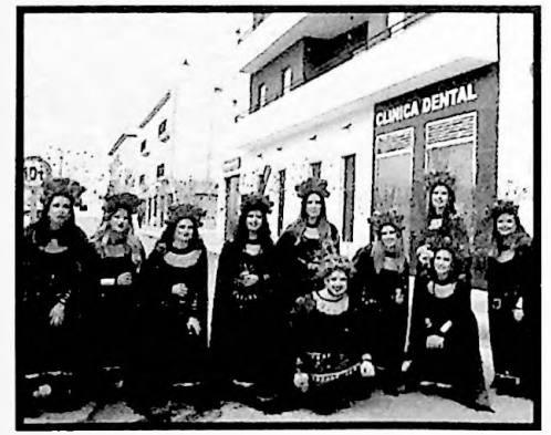
3º PREMIO COMPARSAS EL MITO DE MEDEA