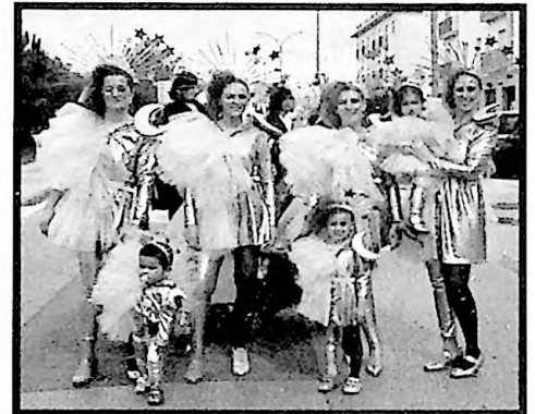
1er PREMIO MURGAS COMO EL DÍA Y LA NOCHE