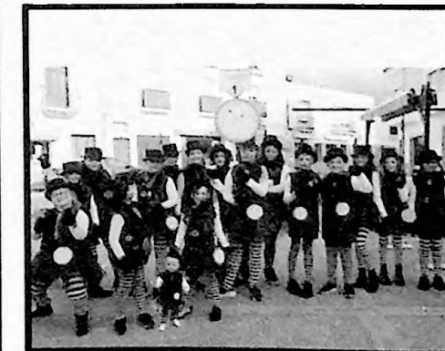
3º PREMIO COMPARSAS LOS QUE DAN LA NOTA, DAN LA HORA