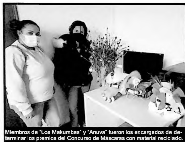
Miembros de "Los Makumbas" y "Anuva" fueron los encargados de determinar los premios del Concurso de Máscaras con material reciclado.

La fiesta comenzó el viernes por la mañana, con el Carnaval de la EI "El Castillo" -esta edición no se celebró desfile