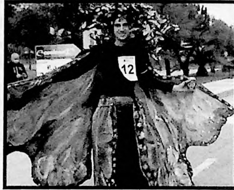
2º PREMIO INDIVIDUAL FANTASÍA AZUL