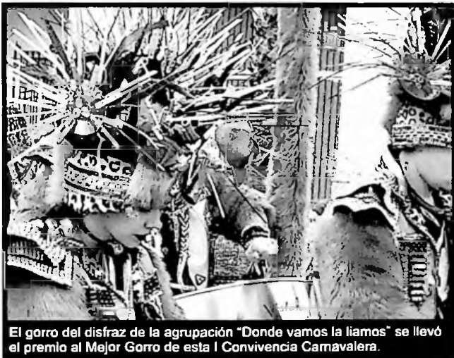
El gorro del disfraz de la agrupación "Donde vamos la liamos" se llevó el premio al Mejor Gorro de esta I Convivencia Carnavalera.

La convivencia consistió en un desfile por la avenida de Portugal y Carretera de Badajoz, y en una fiesta con DJ en una carpa ubicada en la Plaza Francisca Sosa.