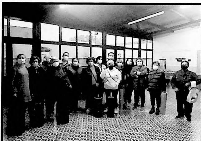
El Alcalde y la Concejala de Cultura, Alfonso C. Macías y Concepción Gutiérrez, visitaron al grupo de usuarias de la oferta deportiva E.R.M.

La duración de la sesión es de una hora en la que la desconexión de las participantes es total. Ambientada la sala donde se desarrolla con música relajante y aromas, que ayudan más al descanso y concentración para seguir las indicaciones de la técnica.