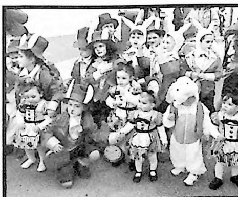
1er PREMIO COMPARSAS BUSCANDO EL PAÍS DE LAS MARAVILLAS