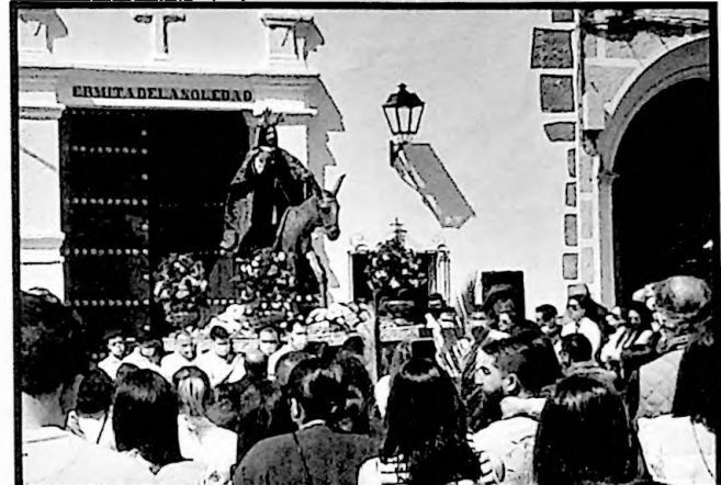
Primera salida procesional tras dos años sin estas en Semana Santa: La Borriquita.

Se permitió la visita a la imagen, que se expuso en la Ermita de la Soledad, para venerarla por parte de sus fieles.