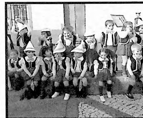
2º PREMIO COMPARSAS LOS PINOCHETES