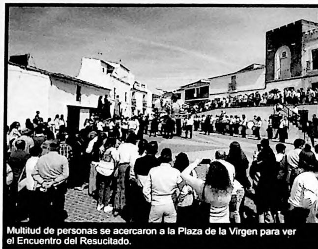
Multitud de personas se acercaron a la Plaza de la Virgen para ver el Encuentro del Resucitado.

El domingo, 17 de abril, se festejaba la Resurrección del Señor. Por la mañana, tras la misa, en la Plaza de la Virgen tuvo lugar el Encuentro del Resucitado con los pasos Cristo Resucitado, María Inmaculada y el conjunto formado por San Juan, Magdalena y Verónica. La Banda Municipal de Música "Guzmán Ricis" fue la encargada de poner el ritmo a este día de júbilo en el que los pasos bailaron por La Estación. ■