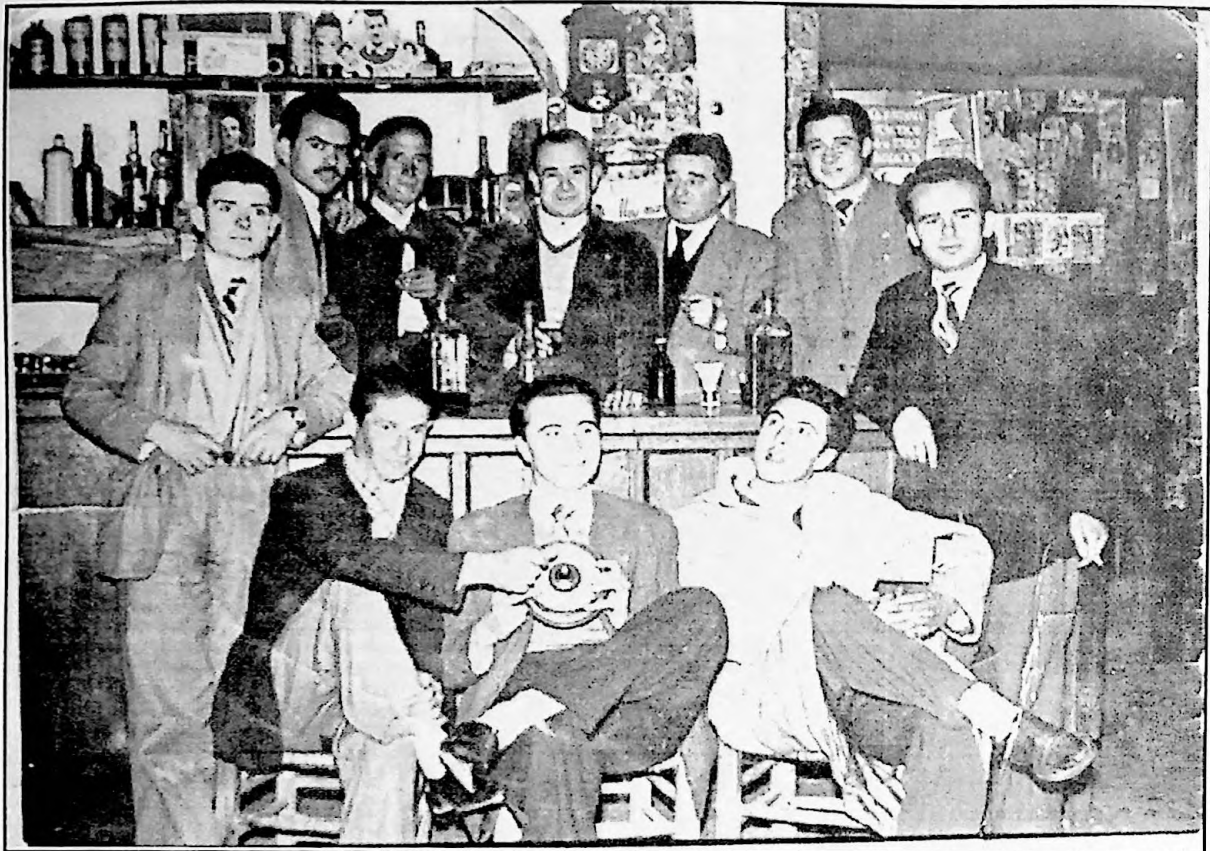
Casa de "Chupito".