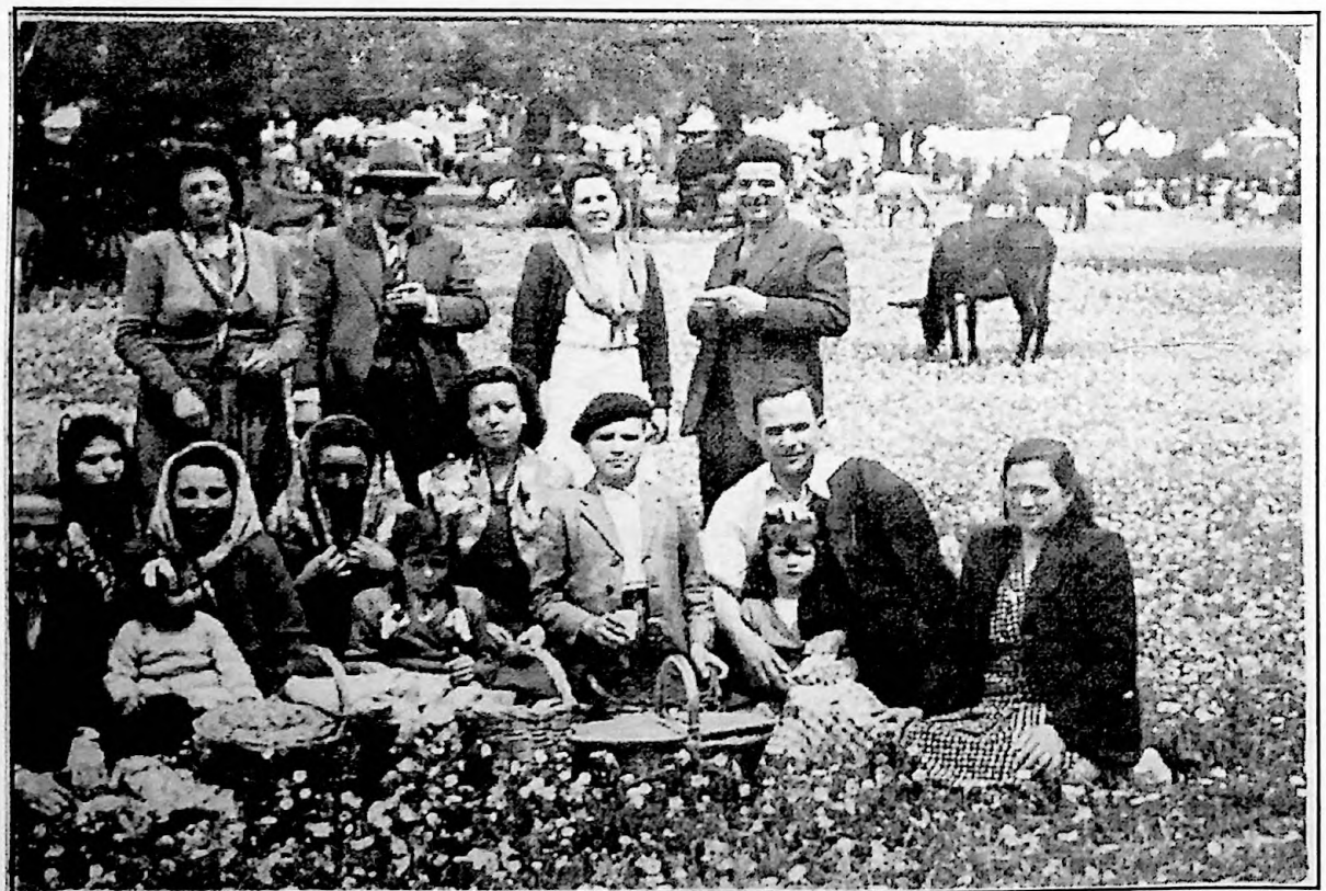
Una romería que se celebró en Rocamador.