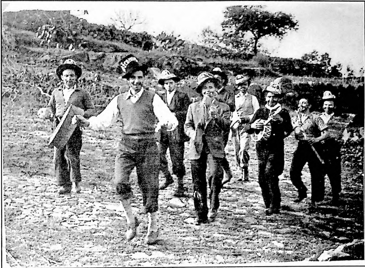
Peña "LA ECONÓMICA"