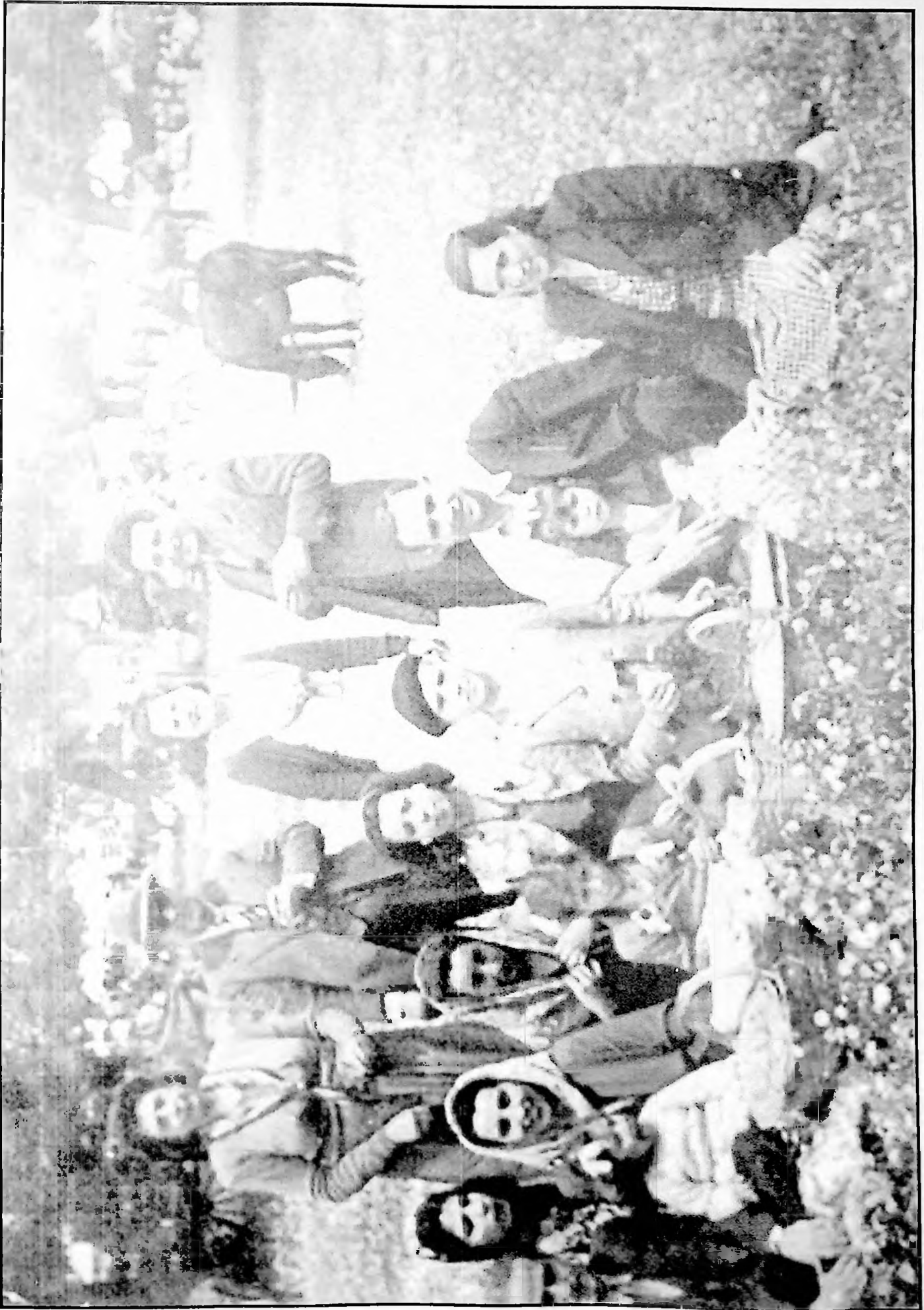
Año de 1946. Apenas superado el trauma de la Guerra Civil Española, las gentes apuestan por la sana diversión, "Una Romería en Rocamador".