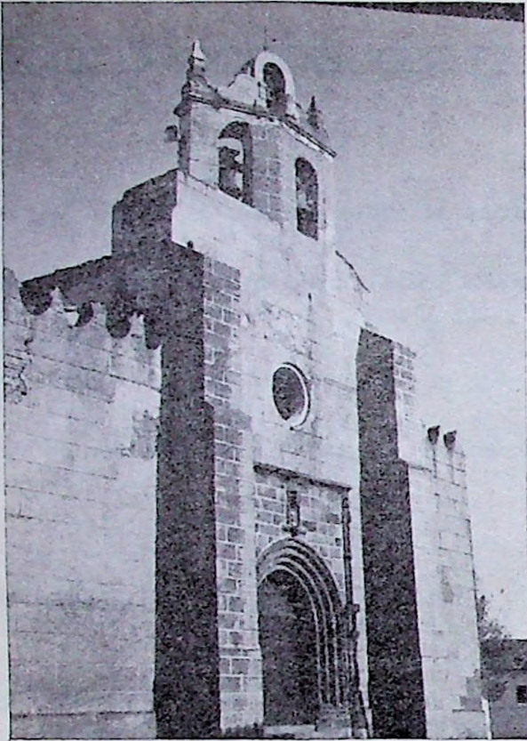
Torre de espadaña de la Iglesia de Santiago Apóstol