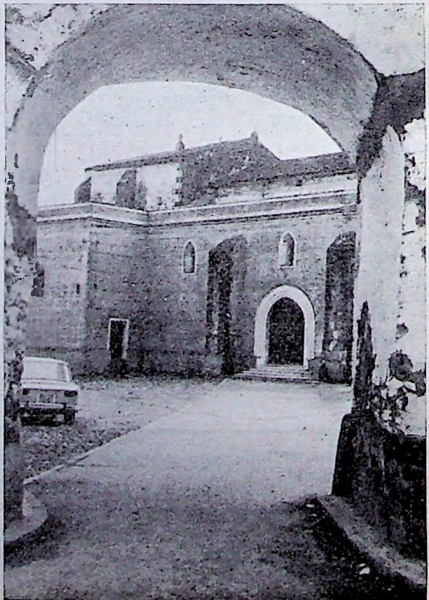
Antiguo arco que da paso a la Plaza de Santiago desde las calles Cruces y Laredo